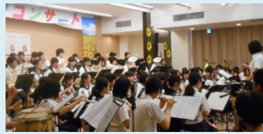
ひまわりコンサートでの 大妻中野吹奏楽部