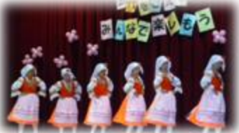
フォークダンス、皆で輪になり踊りました。