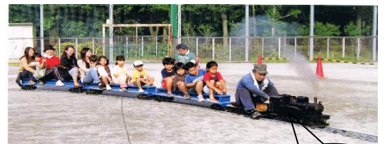
子どもも大人もミニSL