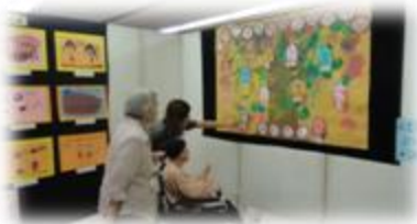
これが中野？昔の中野の写真パネルやスライドも上映。